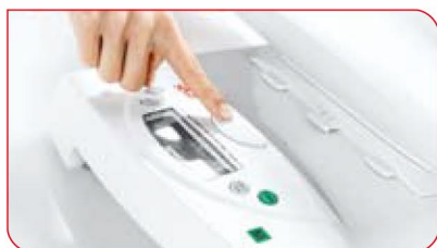
Szalka odłącza się od podstawy za jednym naciśnięciem przycisku.